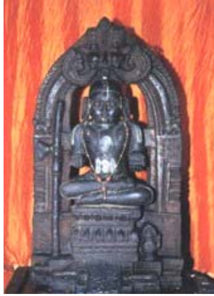
ಶ್ರೀ ಮಧ್ವರು - ಪಾಜಕಕ್ಷೇತ್ರ

ರಾ ಗ - ಪ ಂ ತು ವ ರಾ ಳಿ : ತಾ ಳ - ತಿ ಶ್ರು ಛಾ ಪು