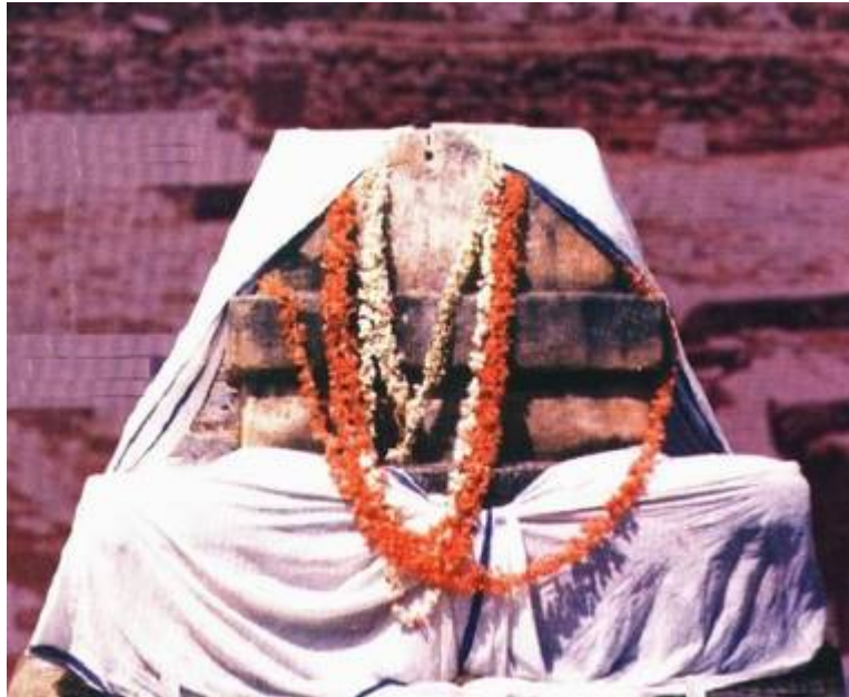
ಶ್ರೀಪದ್ಮನಾಭತೀರ್ಥರು - ನವವೃಂದಾವನ