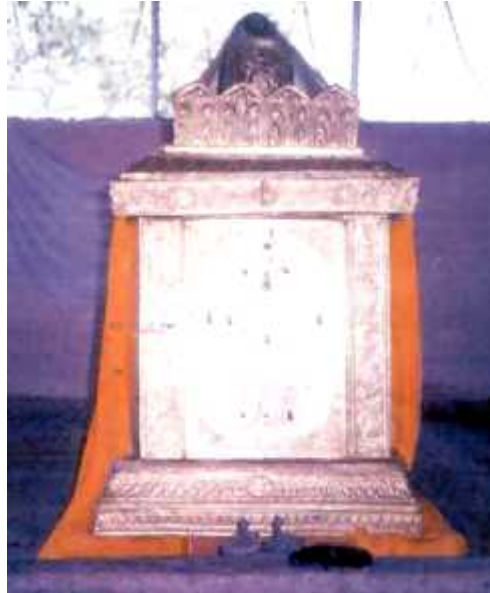
ಶ್ರೀಮಾಧವತೀರ್ಥರು - ಮಣೂರು