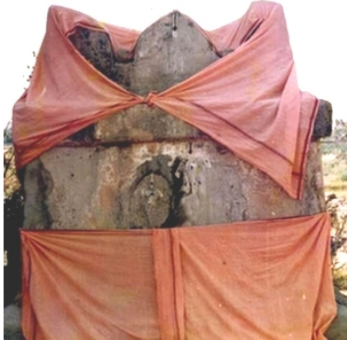
ಶ್ರೀನರಹರಿತೀರ್ಥರು - ಹಂಪೆ

ಭೂದೇವೀ ರಮಣಾಸಕ್ತೋ ರಘ್ವೀಶ ಪದಮಾನಸಃ ನೃಹರ್ಯಾಖ್ಯ ಗುರುಭೂಯಾದಸ್ಮದಿಷ್ಟಾರ್ಥ ಸಿದ್ಧಯೇ ||