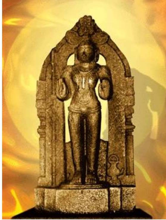
ಶ್ರೀ ಮಧ್ವರು - ಉಡುಪಿ