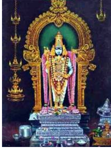
ಶ್ರೀ ಸುಬ್ರಹ್ಮಣ್ಯ - ಪಳನಿ

ಶ್ರೀ ಷಣ್ಮುಖಿ ( ಕುಮಾರಸ್ವಾಮಿ - ಮನ್ಮಥ - ಸ್ಕಂಧ )