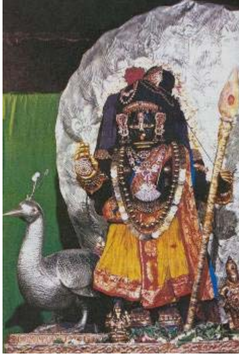
ಉಡುಪಿಯ ಕೃಷ್ಣನಿಗೆ ಸುಬ್ರಹ್ಮಣ್ಯನ ಅಲಂಕಾರ