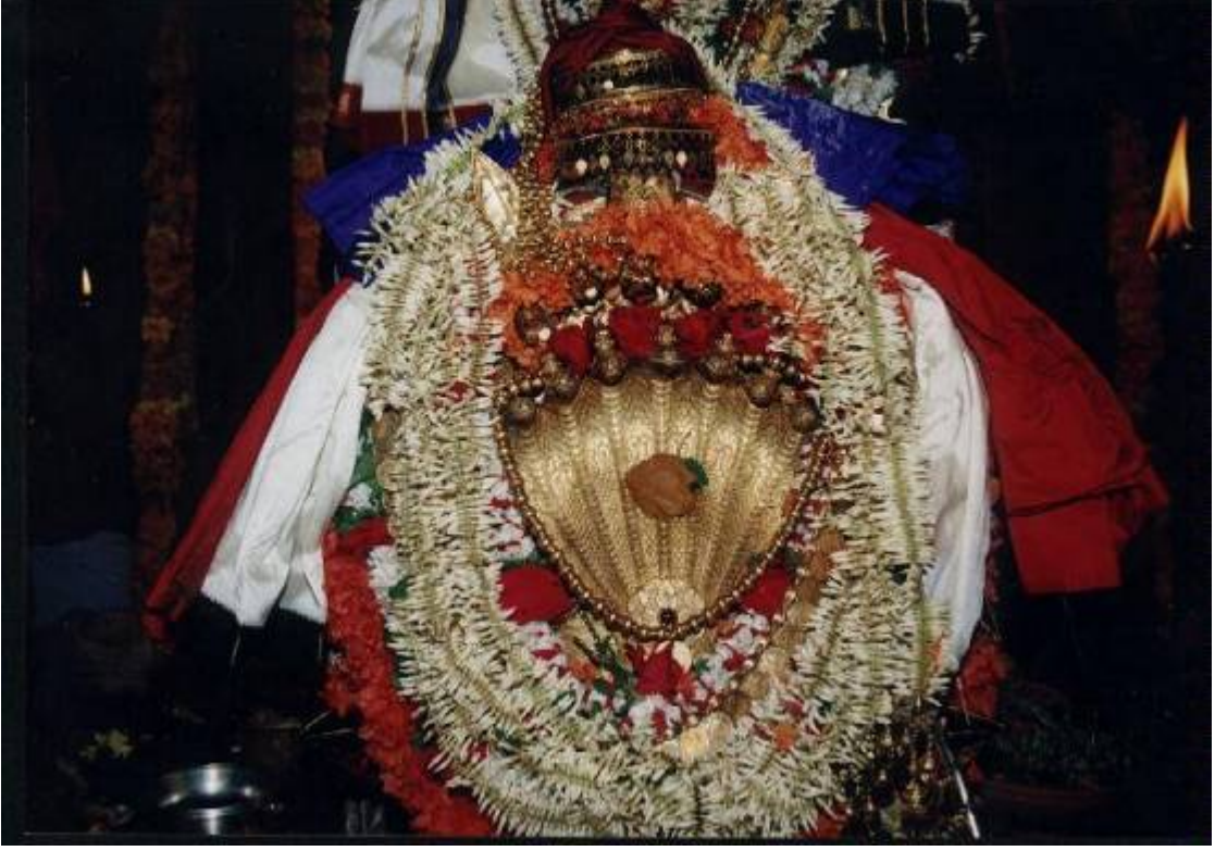
ಶ್ರೀ ಸುಬ್ರಹ್ಮಣ್ಯ - ಮಂಜೇಶ್ವರ