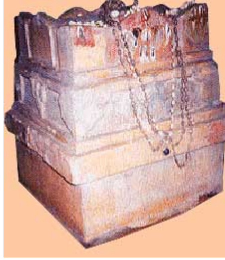
ಶ್ರೀಮದಕ್ಷೋಭ್ಯತೀರ್ಥರು - ಮಳಬೇಡ

ಶ್ರೀ ಮದ್ರಮಾರಮಣ ಸದ್ಗಿರಿಪಾದಸಂಗೀ ವ್ಯಾಖ್ಯಾ ನಿನಾದ ದಲಿತಾಖಿಲ ದುಷ್ಟದರ್ಪಂ ದುರ್ವಾದಿವಾರಣ ವಿದಾರಣ ದಕ್ಷದೀಕ್ಷ- ಮಕ್ಷೋಭ್ಯತೀರ್ಥ ಮೃಗರಾಜಮಹಂ ನಮಾಮಿ