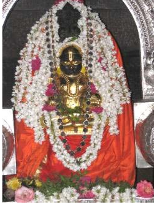
ಶ್ರೀಮದಾನಂದತೀರ್ಥರು - ಪಾಜಕ