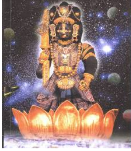
ಉ ಗಾ ಭೋ ಗ : ರಾ ಗ - ನಾ ಟಿ

ಜಯ ಜಯ ಹರಿ ಎಂಬುವುದೆ ಸುದಿನವು | ಜಯ ಜಯ ಹರಿ ಎಂಬುವುದೆ ತಾರಾ ಬಲವು | ಜಯ ಜಯ ಹರಿ ಎಂಬುವುದೆ ಚಂದ್ರ ಬಲವು | ಜಯ ಜಯ ಹರಿ ಎಂಬುವುದೆ ವಿದ್ಯಾ ಬಲವು | ಜಯ ಜಯ ಹರಿ ಎಂಬುವುದೆ ದೈವ ಬಲವು | ಜಯ ಹರಿ ಪುರಂದರ ವಿಟ್ಟಲನ ಬಲವಯ್ಯ ಸುಜನರಿಗೆ ||